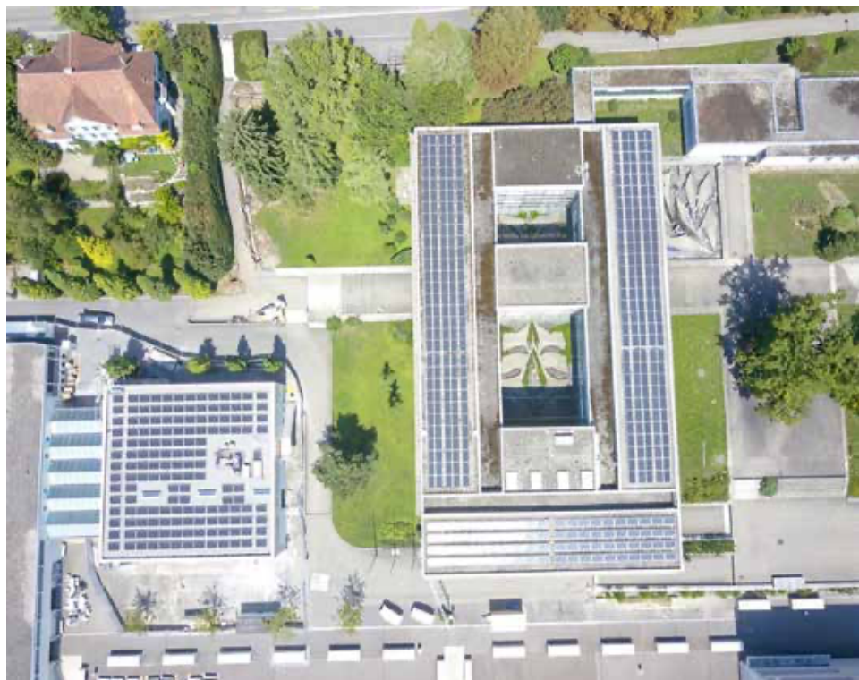
Rysolar-Plus-Anlage auf dem Hauptgebäude und neu auch auf der Mensa.

Freiwilligen, aber auch dank einem zinsgünstigen Darlehen der Jubiläumsstiftung. Anlässlich der Einweihung der neuen Mensa feierten auch wir diesen jüngsten Rysolar-Plus-Spross. Zusammen mit den Anlageteilen auf dem Hauptgebäude, der Mediothek und dem Ergänzungsbau kann die Anlage nun bis zu 160 kW elektrische Leistung produzieren und deckt über das Jahr gerechnet schon fast einen Drittel der von der Schule benötigten elektrischen Energie.